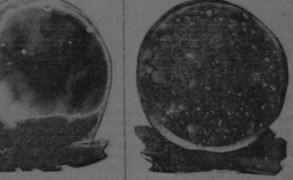
Cultura de un centímetro cuadrado de agua de las fuentes de Tres Ríos. Cultura de un centímetro cuadrado de agua del Tiribí.